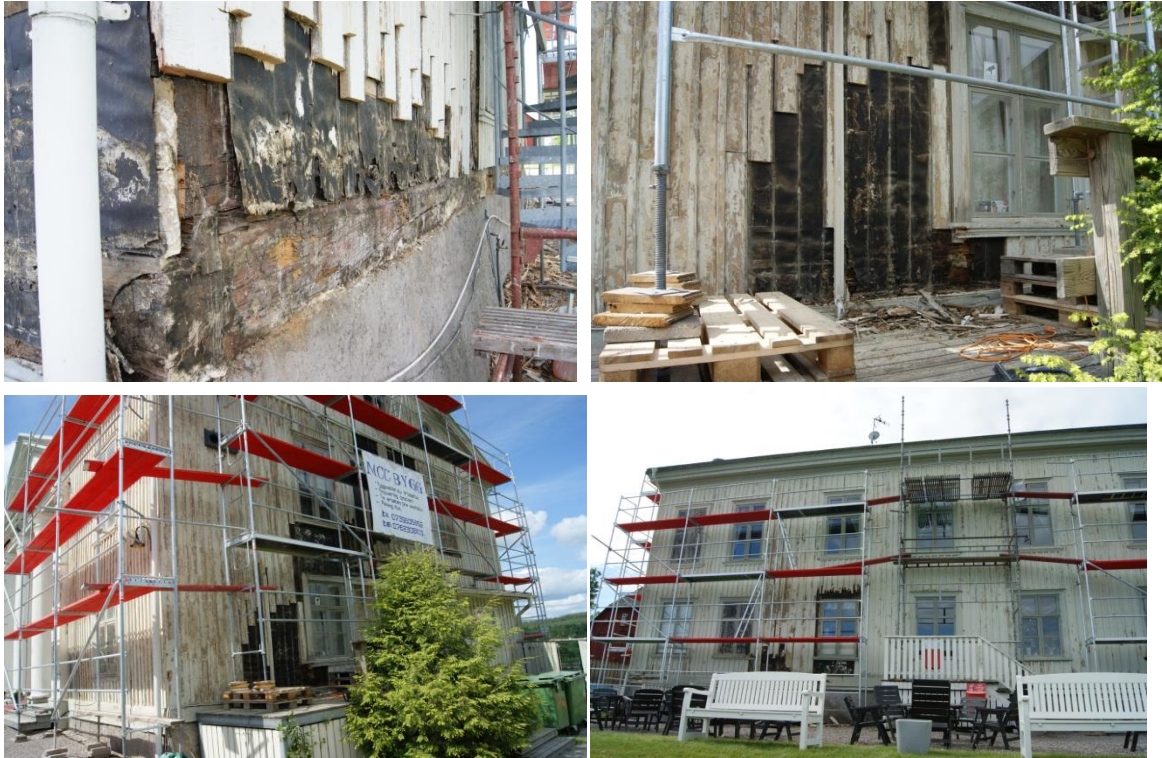
Bilder från de olika fasaderna