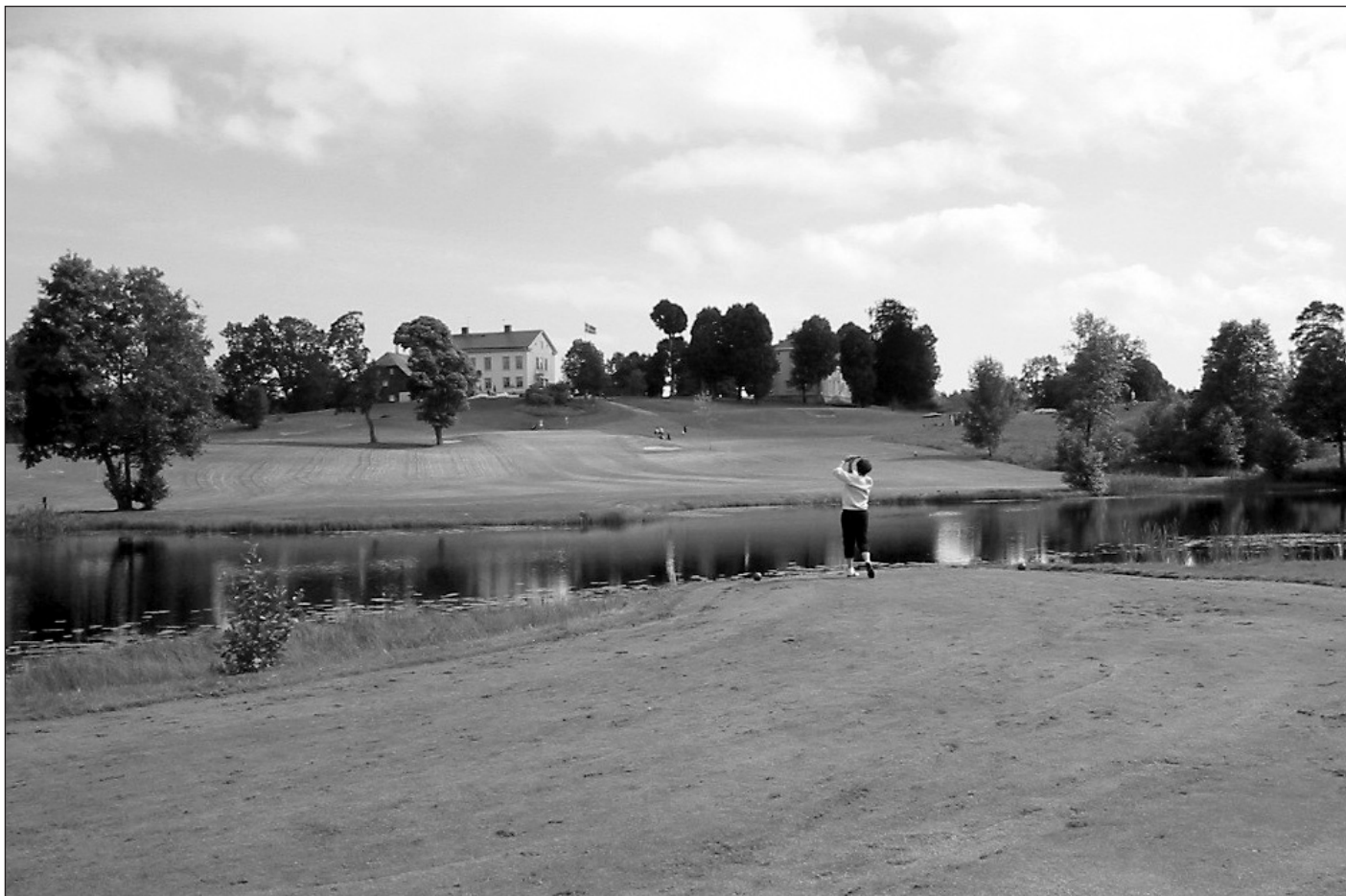
Röd tee, hål 9.